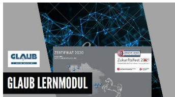
Youtube Video Preisträger – klick Foto

Unser Leistungsspektrum im Bereich Schaltschrankbau und Komponenten finden Sie HIER .