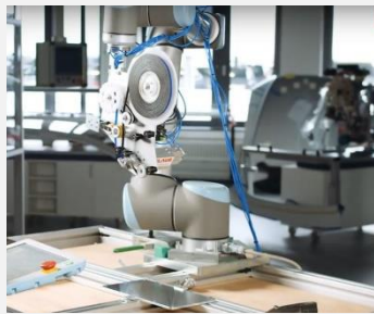
Youtube Video – klick Foto