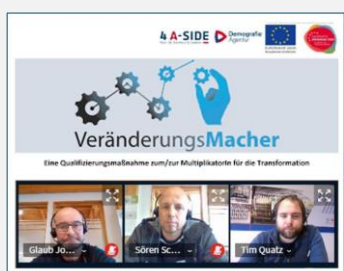
Youtube Kanal GLAUB – klick Foto

JETZT mit unseren Experten Kontakt aufnehmen.