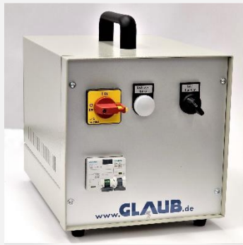
Youtube Video – klick Foto