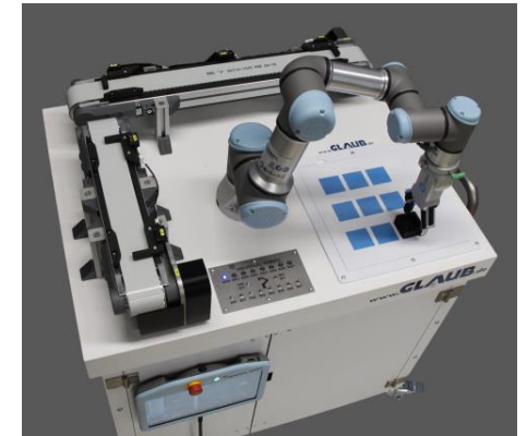
COBOT-Lernstation mit mobilem Unterbau (abschließbar)